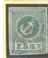
RÉVFÜLÖP 19/7 (blau)