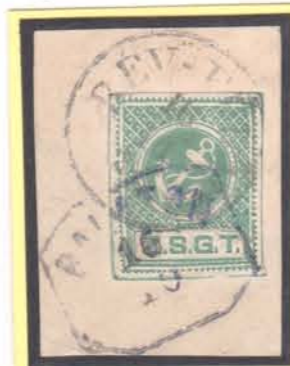
RÉVFÜLÖP 16/10/75 BALATON 16/10